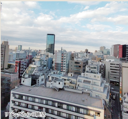
リビングからの眺望