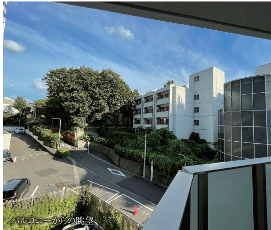
バルコニーからの眺望