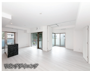
リビングダイニング