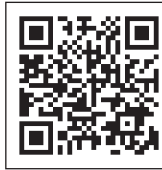
物件詳細はこちらから