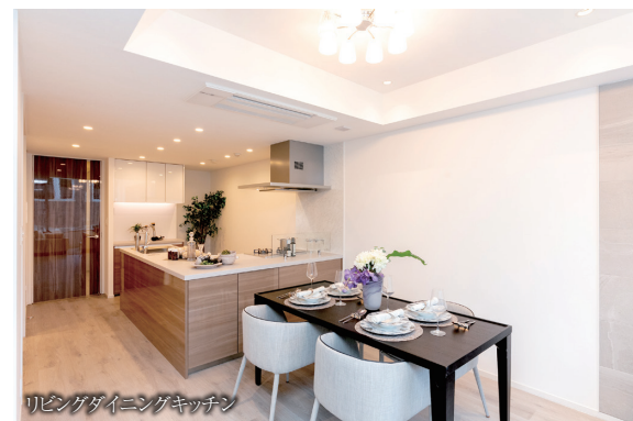
リビングダイニングキッチン