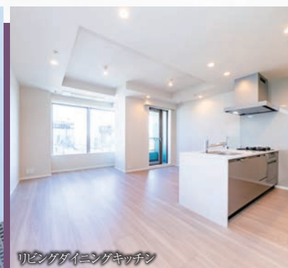
リビングダイニングキッチン