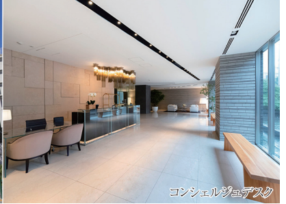
コンシェルジュデスク