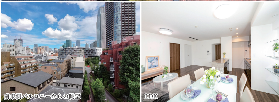
南東側バルコニーからの眺望