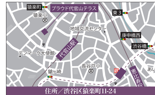
住所/渋谷区猿樂町11-24